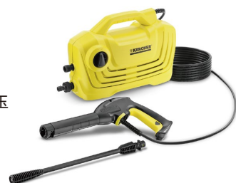
ケルヒャー高圧洗浄機K2クラシック